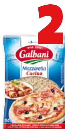
Queso Mozzarella GALBANI rallado, 150 grs.