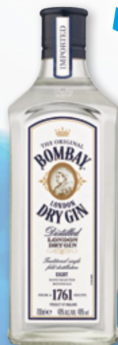
Ginebra BOMBAY original, 70 cl.