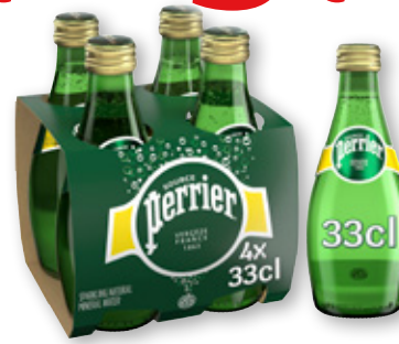
Agua con gas PERRIER , pack 4 unds. x 33 cl.