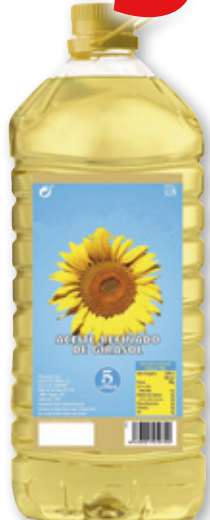
Aceite de girasol, 5 litros.