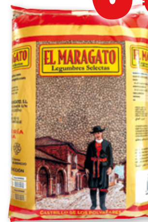
Lenteja parda EL MARAGATO , 5 kilos.