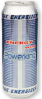
Bebida energética POWERKING , 500 ml.