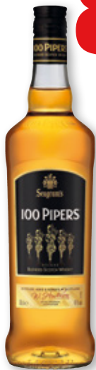
Whisky 100 PIPERS , 70 cl.