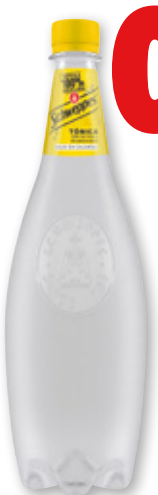
Tónica SCHWEPES original o zero, litro.