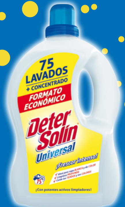
Detergente líquido DETERSOLÍN universal, 75 dosis.