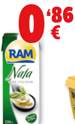
Nata RAM para cocinar, 18% m.g., 200 ml.