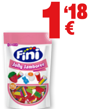
Regaliz FINI Jolly Jamboree, 165 grs.