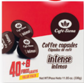
Café SIENA intenso compatible con Dolce Gusto, 48 cápsulas, 336 grs.