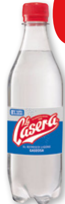
Gaseosa LA CASERA , 0,5 litros.