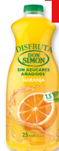
Disfruta DON SIMON naranja, 1,5 litros.