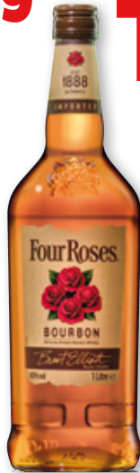
Bourbon FOUR ROSES , litro.