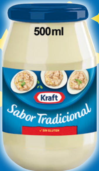
Salsa KRAFT , 500 ml.