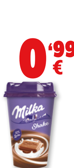
Batido MILKA , vaso 200 ml.