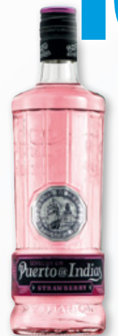
Ginebra PUERTO DE INDIAS classic, strawberry, sweet melon o exotic blackberry, 70 cl.