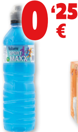
Bebida isotónica VALTORRE Sport Maxx , 0,5 litros.