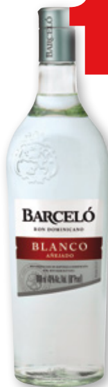
Ron BARCELÓ blanco, litro.