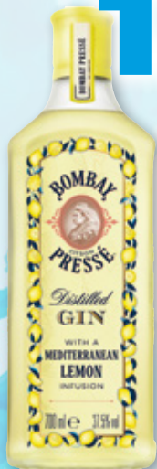
Ginebra BOMBAY Citron Pressé, 70 cl.