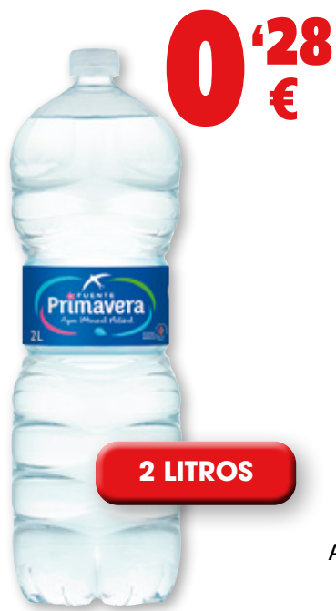
Agua mineral FUENTE PRIMAVERA , 2 litros.