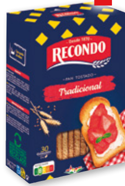
Pan tostado RECONDO variedades, 30 rebanadas, 270 grs.