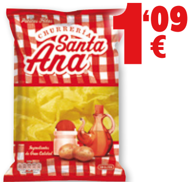
Patatas fritas SANTA ANA , 150 grs.