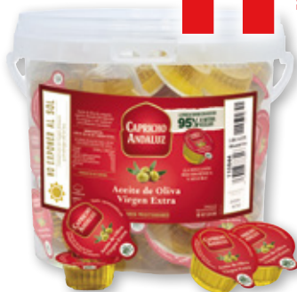
Aceite de Oliva Virgen Extra CAPRICH ANDALUZ , pack 100 cápsulas x 10 ml.