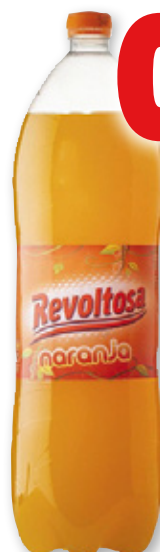
Refresco REVOLTOSA naranja o limón, 2 litros.