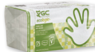
Toallas ecologic GC , 2 capas, pack 196 unds.