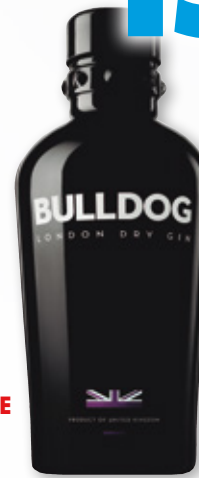
Ginebra BULLDOG , 70 cl.