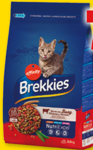
Alimento para gatos BREKKIES buey, 3,5 kilos.