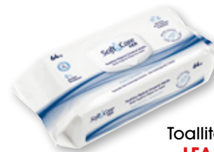
Toallitas de adulto LEA Soft&Care, pack 64 unds.