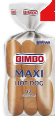
Pan BIMBO Hot Dog, pack 12 unds., 660 grs.