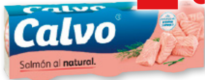
Salmón al natural CALVO , RO-80, pack 3 unds., 335 grs., 150 grs. p.e.