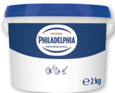
PHILADELPHIA , 2 kilos.