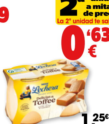
Postre Delicias LA LECHERA de toffee, galleta María o trufa, pack 2 unds. x 125 grs.