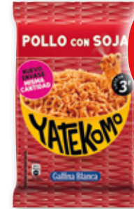
Yatekomo GALLINA BLANCA pollo con soja, 82 grs.