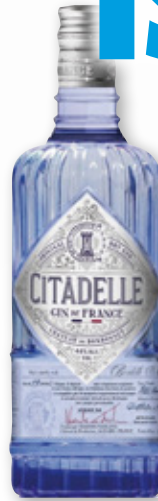
Ginebra CITADELLE original, 70 cl.