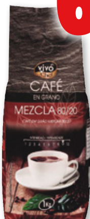
Café en grano VIVO CHEF mezcla 80/20, kilo.