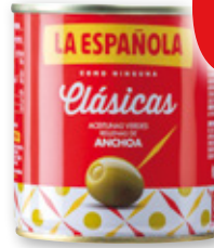
Aceitunas rellenas LA ESPAÑOLA , 200 grs., 85 grs. p.e.