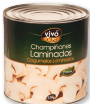
Champiñones laminados VIVO CHEF , 2,5 kilos, 1,33 kilos p.e.