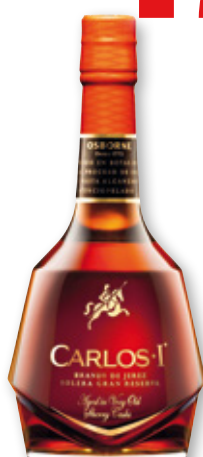
Brandy CARLOS I , 70 cl.