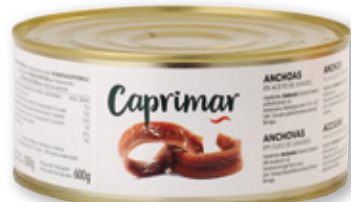
Filetes de Anchoa CAPRIMAR en aceite vegetal, RO-1.000, 600 grs. p.e.