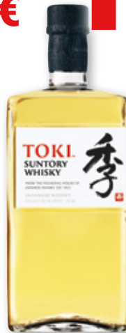
Whisky TOKI , 70 cl.