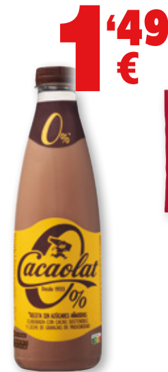
Batido de cacao CACAOLAT 0% m.g., litro.