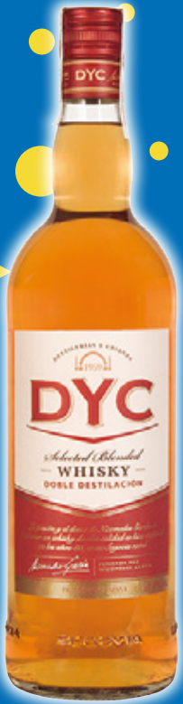
Whisky DYC 5 años, litro.