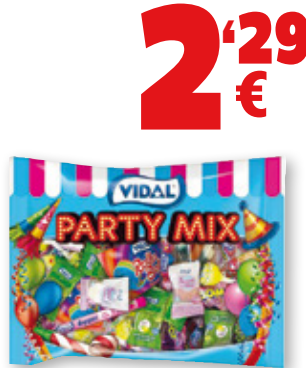
Golosinas Party Mix VIDAL , 400 grs.