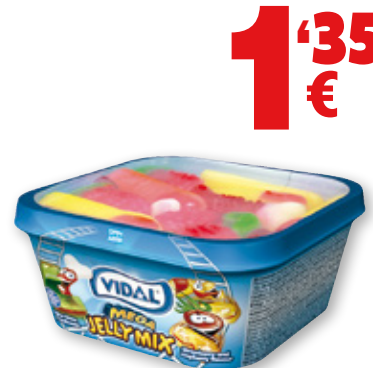
Gominolas VIDAL mega surtido ácido o brillo, 180 grs.