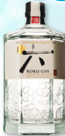
Ginebra ROKU , 70 cl.