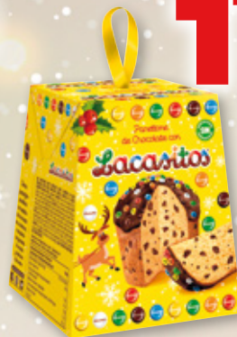
Panettone LACASA de chocolate con Lacasitos, 100 grs.