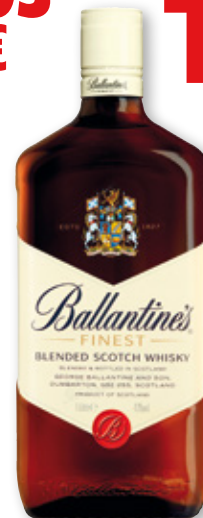
Whisky BALLANTINE'S , litro.