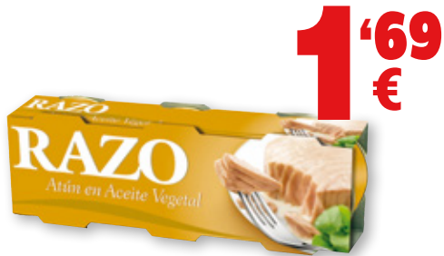
Atún RAZO en aceite vegetal, pack 3 unds., 240 grs., 156 grs. p.e.