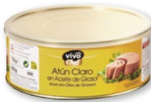
Atún claro VIVO CHEF en aceite de girasol, RO-800, 650 grs. p.e.