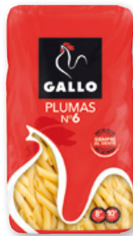
Pasta clásica tenedor GALLO plumas 3, plumas 6, hélices, spaghetti 3 o tallarín, 450 grs.