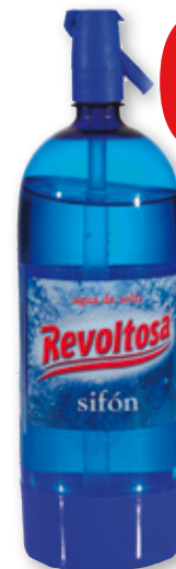
Sifón REVOLTOSA , 1,5 litros.