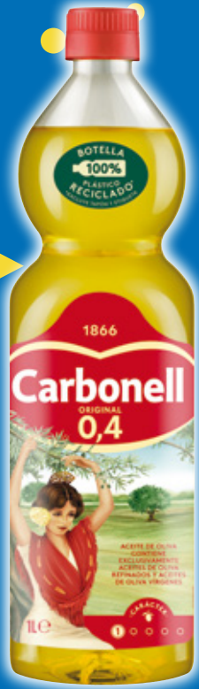
Aceite de oliva CARBONELL original 0,4° o sabor 1°, litro.