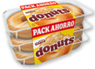
DONUTS glacé, pack 6 unds.