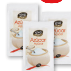
Azúcar VIVO CHEF , pack 1.000 sobres x 5 grs.