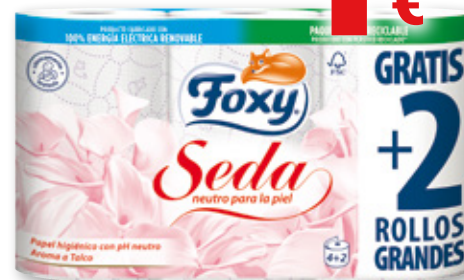
Papel higiénico FOXY Seda, 3 capas, pack 4 rollos + 2 GRATIS.