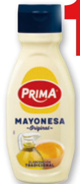
Mayonesa PRIMA , 400 grs.