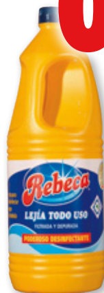
Lejía REBECA normal o lavadora, 2 litros.