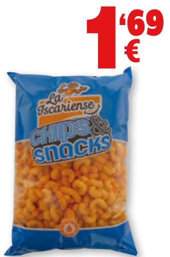
Ganchitos rojos LA ISCARIENSE al queso, 300 grs.