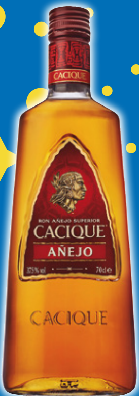
Ron CACIQUE añejo, 70 cl.