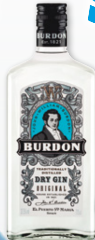
Ginebra BURDON original, 70 cl.