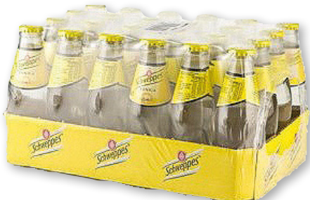
Tónica SCHWEPES original, pack 24 unds. x 20 cl.