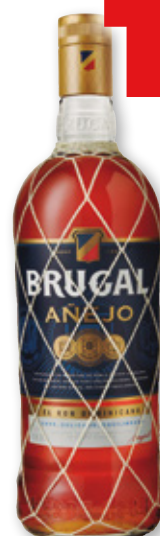
Ron BRUGAL añejo, litro.