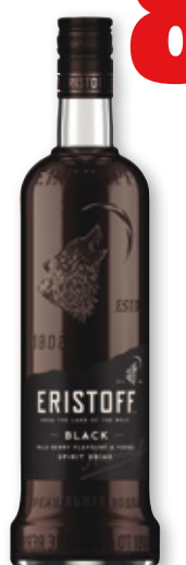
Vodka ERISTOFF black, 70 cl.