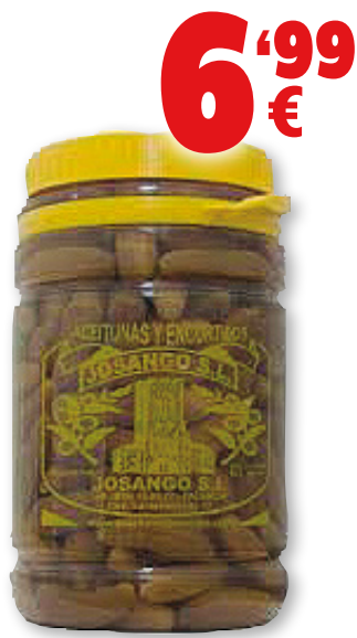
Pepinillos JOSANGO medianos, 3,3 kilos, 2 kilos p.e.