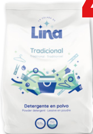
Detergente LA COLADA DE LINA Tradicional, 150 lavados.