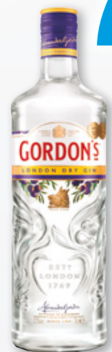
Ginebra GORDON'S , 70 cl.