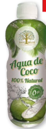
Agua de coco TESORO NATURAL , litro.