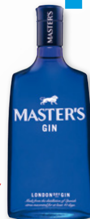
Ginebra MASTER'S Dry, 70 cl.