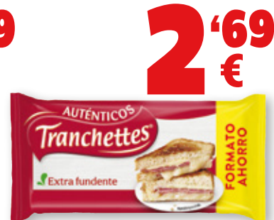
Queso TRANCHETTES , 22 lonchas, 412,5 grs.