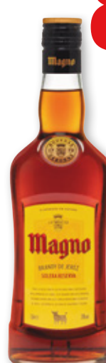
Brandy MAGNO , 70 cl.