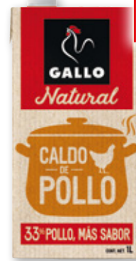
Caldo GALLO de pollo o cocido, litro.