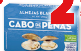
Almejas al natural CABO DE PEÑAS , OL-111, 63 grs. p.e.