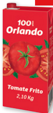
Tomate frito ORLANDO , 2,1 kilos.