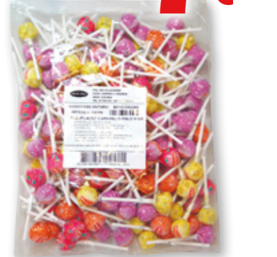
Caramelos MIGUELAÑEZ palo 9 grs., bolsa 145 unds.