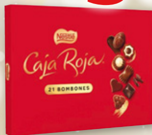
Bombones NESTLÉ Caja Roja, 198 grs.