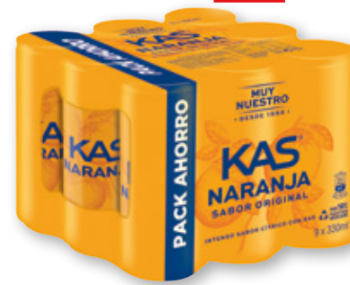
KAS naranja o limón, pack 9 unds. x 33 cl.