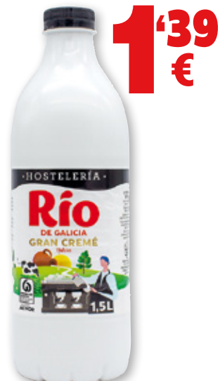
Leche RÍO Gran Cremé, 1,5 litros.