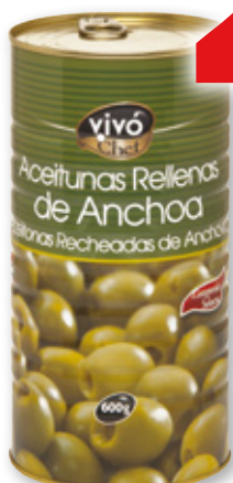
Aceitunas Rellenas de Anchoa VIVO CHEF , 1,4 kilos, 600 grs. p.e.