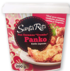
Pan en escamas Panko SANTA RITA estilo japonés, 200 grs.