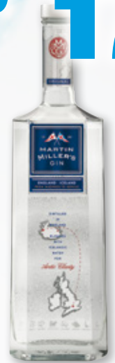
Ginebra MARTIN MILLER'S , 70 cl.