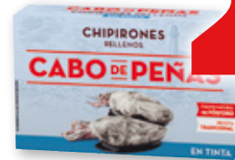
Chipirones rellenos CABO DE PEÑAS en tinta, OL-111, 70 grs. p.e.