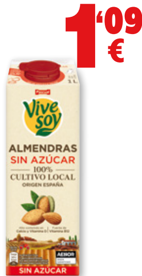
Bebida sin azúcar VIVE SOY almendras o soja, litro.