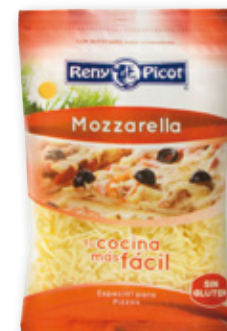
Mozzarella RENY PICOT rallado, kilo.