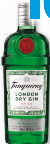
Ginebra TANQUERAY , 70 cl.