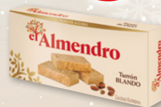
Turrón EL ALMENDRO blando o duro, 250 grs.