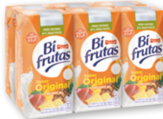
Bífrutas PASCUAL Tropical, pack 6 unds. x 20 cl.