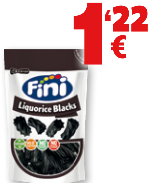
Regaliz FINI taco negro, 180 grs.