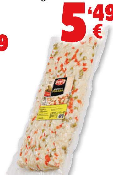
Preparado de ensaladilla BENIS , 2 kilos.