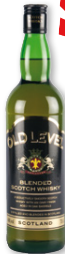
Whisky OLD LEVEL , 70 cl.