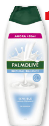
Gel de ducha PALMOLIVE Natural Balance hidratante o leche y miel, 600 ml.