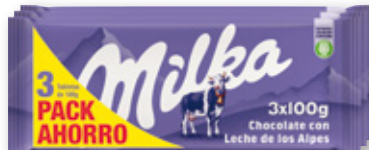
Chocolate con leche MILKA , pack 3 unds. x 100 grs.