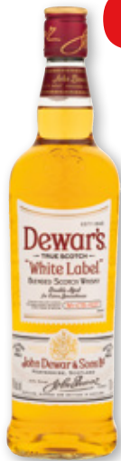
Whisky DEWAR'S White Label, 70 cl.