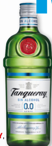
Bebida TANQUERAY 0,0%, 70 cl.