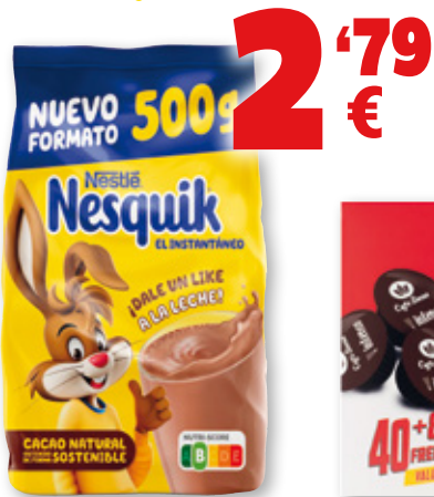
Cacao soluble NESQUIK , 500 grs.