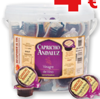
Vinagre de Vino CAPRICH ANDALUZ , pack 100 cápsulas x 10 ml.