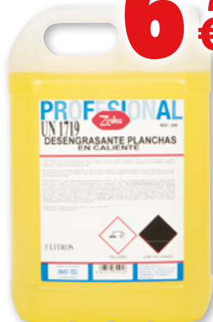
Desengrasante planchas en caliente ZORKA , 5 litros.