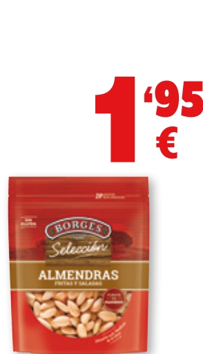
Almendras BORGES fritas y saladas, 160 grs.