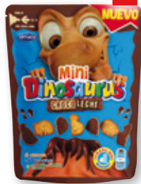
Galletas mini DINOSAURUS chocolate, 120 grs.