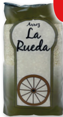
Arroz LA RUEDA , kilo.