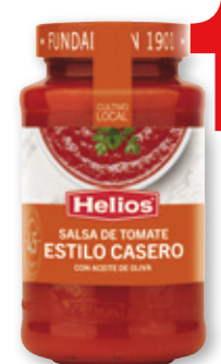
Salsa de tomate HELIOS estilo casero, 570 grs.