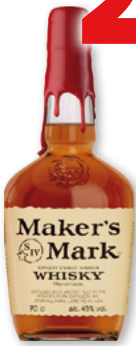
Bourbon MAKER'S MARK , 70 cl.