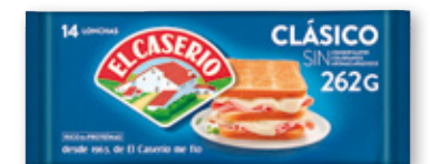
Queso EL CASERÍO CLÁSICO SIN AZÚCAR, 14 lonchas, 262 grs.