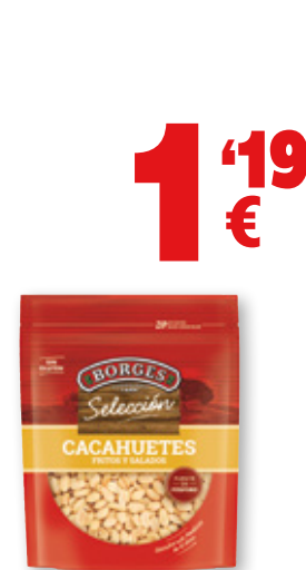
Cacahuetses BORGES fritos y salados, 200 grs.