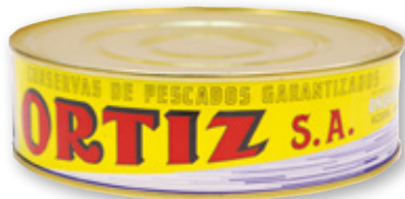
Lomos de bonito deshojados ORTIZ en aceite de girasol, RO-1.800, 1.075 grs. p.e.