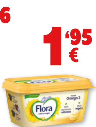
Margarina FLORA original, 400 grs.