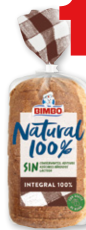
Pan BIMBO natural 100% integral, 360 grs.