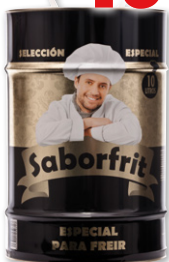
Aceite especial para freír SABORFRIT , 10 litros.