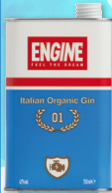
Ginebra ENGINE , 70 cl.