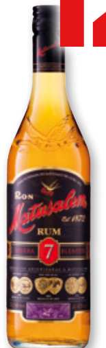
Ron MATUSALEM Solera 7 años, 70 cl.