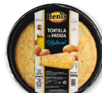
Tortilla con o sin cebolla BENIS , 1 kilo.