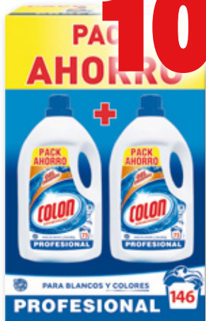
Detergente en gel COLON Profesional, 9,8 litros, pack 2 unds. x 73 dosis.