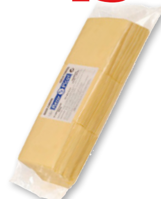
Queso fundido RENY PICOT , 72 lochas, 1,584 kilos.