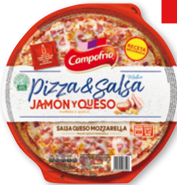
Pizza con salsa CAMPOFRÍO jamón y queso, barbacoa, carbonara, 5 quesos o pepperoni picante, unidad.