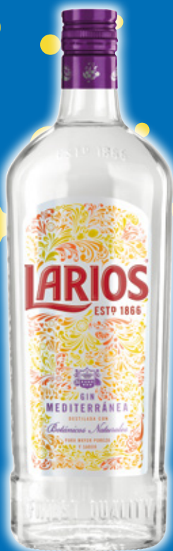
Ginebra LARIOS , litro.