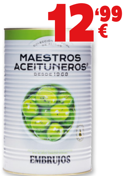
Aceitunas MAESTROS ACEITUNEROS Embrujos, 4,6 kilos, 2,5 kilos p.e.