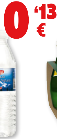
Agua mineral VIVÓ , 50 cl.