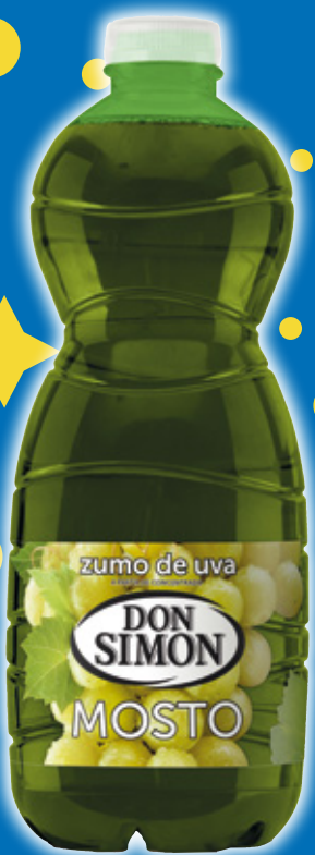
Mosto DON SIMON blanco o tinto, litro.