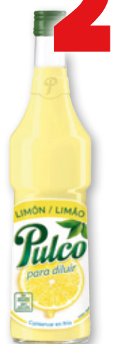
Jugo de limón PULCO , 70 cl.