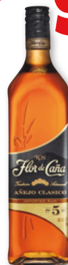
Ron FLOR DE CAÑA 5 años, Etiqueta Negra, 70 cl.