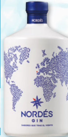
Ginebra NORDÉS Atlantic Galician, 70 cl.