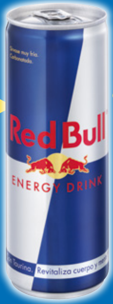
Bebida energética RED BULL , 250 ml.