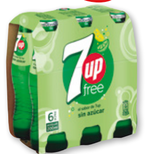
SEVEN UP free lima, pack 6 unds. x 20 cl.