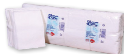
Servilletas mini servis GC , pack 400 unds.