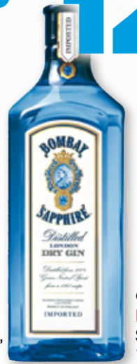
Ginebra BOMBAY Sapphire, 70 cl.