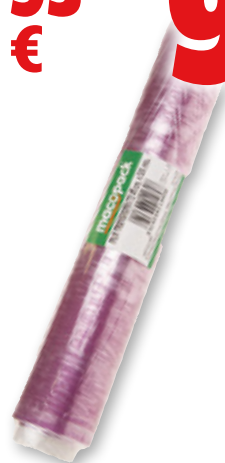
Film MACOPACK , recambio 45x300 metros.