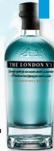
Ginebra THE LONDON N°1 , 70 cl.