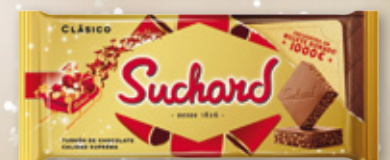
Turrón clásico SUCHARD chocolate crujiente, 230 grs.