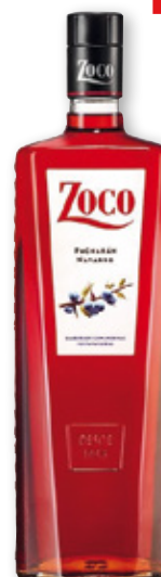
Pacharán ZOCO , litro.