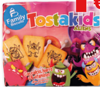
Galletas FAMILY BISCUITS Tostakids Aliens, pack 3 unds. x 200 grs.