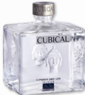
Ginebra CUBICAL Premium London dry, 70 cl.