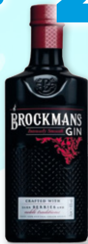
Ginebra BROCKMANS , 70 cl.