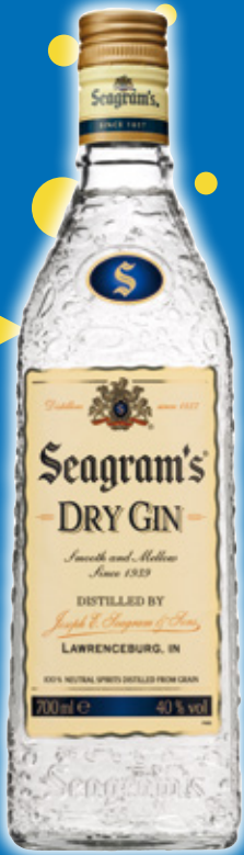
Ginebra SEAGRAM'S añeja, 70 cl.