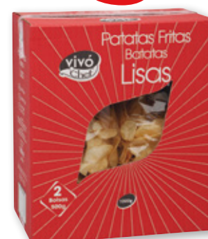
Patatas fritas lisas VIVO CHEF , pack 2 unds. x 500 grs.