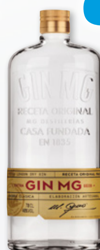
Ginebra MG original dry, 70 cl.