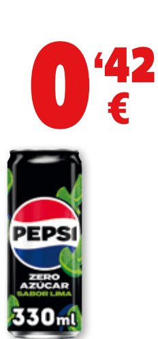
PEPSI zero lima, 33 cl.