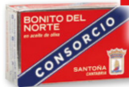
Bonito del norte CONSORCIO en aceite de oliva, OL-120, 81 grs. p.e.