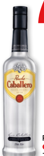
Ponche CABALLERO , 70 cl.