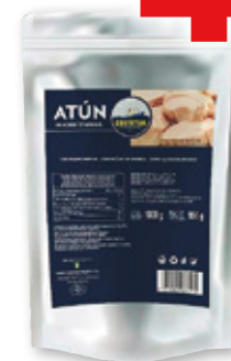
Atún en aceite de girasol COSTATUN , 1 kilo, 950 grs. p.e.