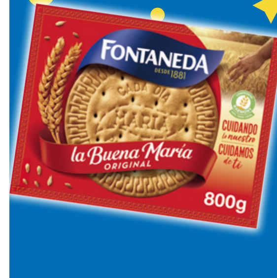
Galletas María FONTANEDA , 800 grs.