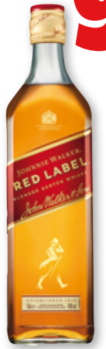
Whisky JOHNNIE WALKER Red Label, 70 cl.