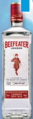
Ginebra BEEFEATER , 70 cl.