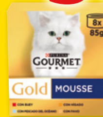
Alimento para gatos GOURMET Gold surtido tartalette o mousse, pack 8 unds. x 85 grs.