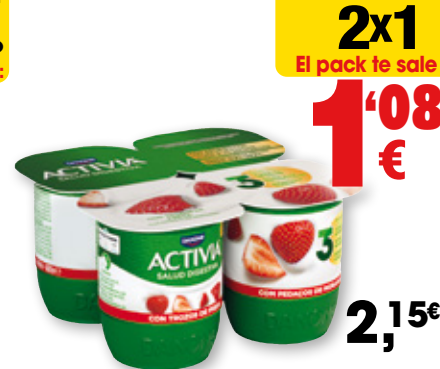
Yogur ACTIVIA de DANONE con fresa, frutos del bosque, mango, pera o desnatado con ciruelas, frutos rojos, kiwi, lima y limón, melocotón o piña o triple 0 melocotón, pack 4 unds. x 120 grs.