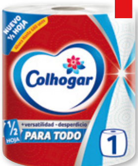
Papel de cocina COLHOGAR para todo, 1 rollo.