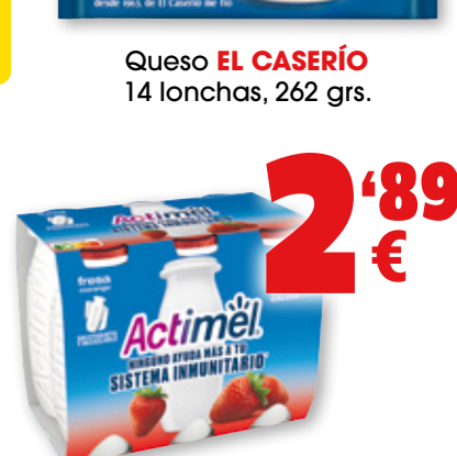
Yogur ACTIMEL de DANONE fresa, frutos del bosque, desnatado fresa, multifrutas o naranja multifrutas, pack 6 unds. x 100 grs.

2ª unidad a mitad de precio La 2ª unidad te sale a: