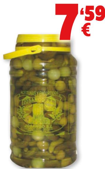
Cocktail vegetal JOSANGO , 3,4 kilos, 2 kilos p.e.