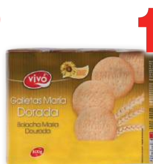
Galletas VIVÓ María Dorada, pack 4 unds. x 200 grs.