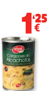
Corazones de Alcachofas VIVÓ 5/7 frutos, 390 grs., 240 grs. p.e.