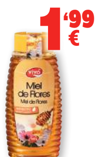
Miel de flores VIVÓ antigoteo, 500 grs.