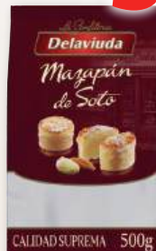
Mazapán de Soto DELAVIUDA , 500 grs.