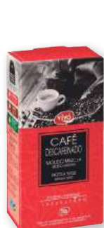
Café VIVÓ descafeinado molido mezcla, 250 grs.