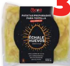
Patatas preparadas para tortilla ÉCHALE HUEVOS con o sin cebolla, 900 grs.