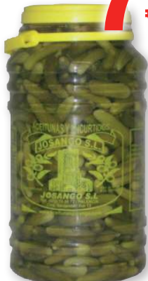
Pepinillos pequeños JOSANGO sabor anchoa, 3,3 kilos, 2 kilos p.e.