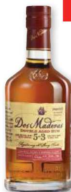
Ron DOS MADERAS 5+3, 70 cl.