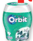
Chicle ORBIT eucalipto, menta, fresa, hierbabuena, menta fuerte o bubblemint, 46 grageas, 64 grs.

2ª unidad a mitad de precio La 2ª unidad te sale a: