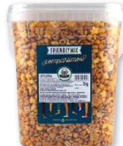
Cóctel EL NOGAL especial Horecca, 3 kilos.