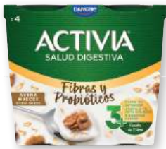
Yogur ACTIVA de DANONE fibras con avena, nuez y manzana, con cereales, con avena y nueces o con muesli; 0% fibras con muesli, con cereales o con chía y almendras, pack 4 unds. x 115 grs.