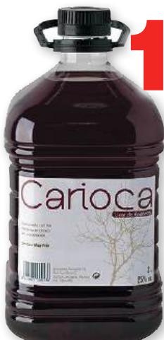
Licor de Endrinas CARIOCA , 3 litros.