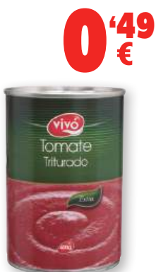
Tomate triturado VIVÓ natural, 400 grs.