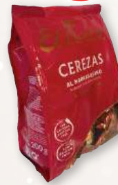
Cerezas al Marrasquino EL AVIÓN , 200 grs.