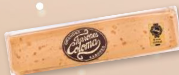
Turrón COLOMA calidad suprema con miel de azahar, Alicante o Jijona, 300 grs.