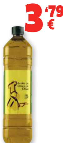
Aceite de Orujo de Oliva, litro.