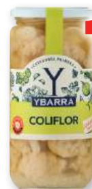
Coliflor al natural YBARRA , 660 grs., 400 grs. p.e.