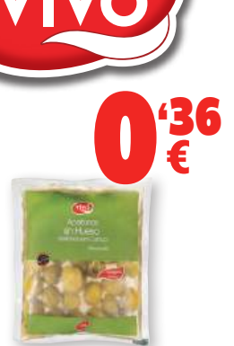
Aceitunas sin hueso VIVÓ , 70 grs.