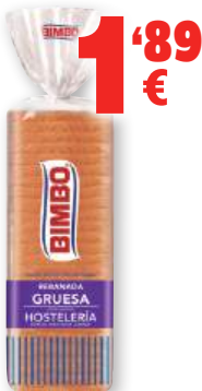
Pan BIMBO hostelería, rebanada gruesa, 1.000 grs.