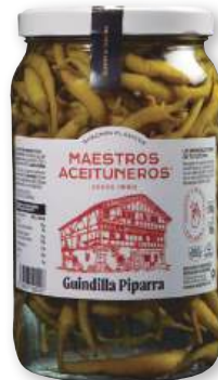
Guindilla Piparra MAESTROS ACEITUNEROS , 1.700 grs., 700 grs. p.e.