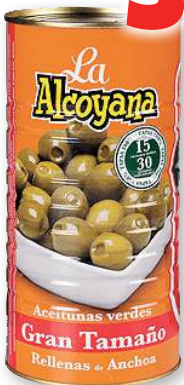
Aceitunas LA ALCOYANA rellenas de anchoa, 2.000 grs., 600 grs. p.e.