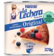
Leche condensada LA LECHERA , 370 grs.