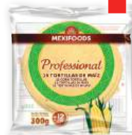
Tortillas de maíz MEXIFOODS , 12 cm., pack 15 unds., 300 grs.