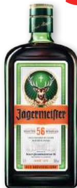
Licor JAGERMEISTER , 70 cl.