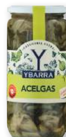
Acelgas YBARRA , 660 grs., 425 grs. p.e.