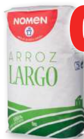
Arroz largo NOMEN , kilo.