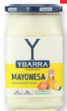
Mayonesa YBARRA , 400 ml.