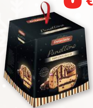
Panettone DELAVIUDA tres chocolates, 750 grs.