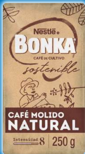
Café molido BONKA natural o mezcla 70/30, 250 grs.