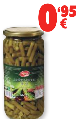
Judías verdes VIVÓ redondas, 660 grs., 360 grs. p.e.