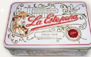
Surtido LA ESTEPEÑA , 300 grs.