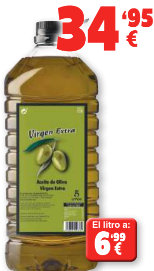
Aceite de Oliva Virgen Extra, 5 litros.