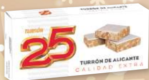
Turrón 25 Calidad Extra Alicante o Jijona, 150 grs.