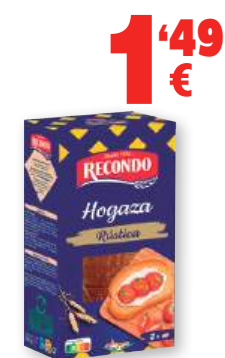
Hogaza RECONDO rústica o 100% integral con pipas, 240 grs.