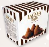
Trufas LACASA al cacao puro, 200 grs.