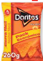
Aperitivos DORITOS Tex-Mex, 260 grs.