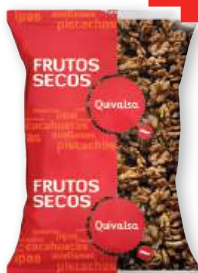
Nuez QUIVALSA pelada, bolsa 500 grs.