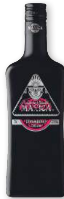
Crema de tequila MAXICA fresa o sandía, 70 cl.