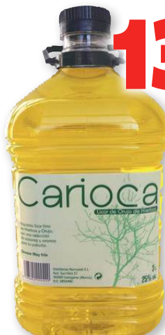
Licor de hierbas CARIOCA , 3 litros.