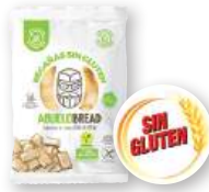
Regañás ABUELO BREAD sin gluten, 100 grs.