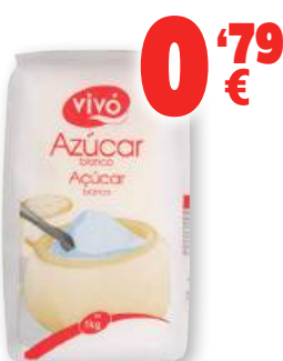
Azúcar VIVÓ , kilo.