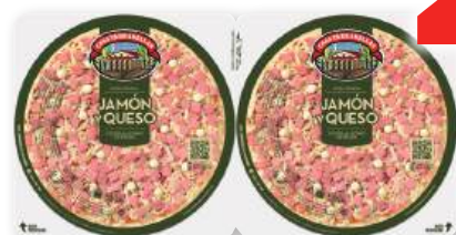
Pizza TARRADELLAS jamón y queso o barbaoco, pack 2 unds., 440 grs.