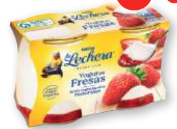
Yogur LA LECHERA con fresas con arándanos o con melocotón, pack 2 unds. x 125 grs.