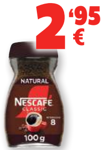
Café soluble NESCAFÉ natural o descafeinado, 100 grs.