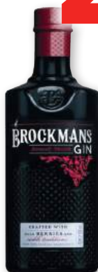
Ginebra BROCKMANS , 70 cl.