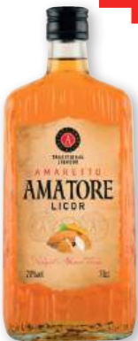
Licor Amaretto AMATORE , 70 cl.