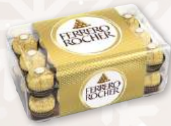
Bombones FERRERO ROCHER , 375 grs.