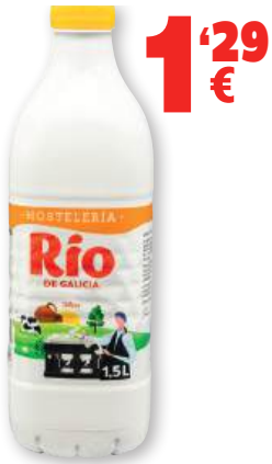
Leche RIO hostelería, 1,5 litros.