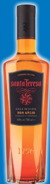
Ron SANTA TERESA Gran Reserva, 70 cl.