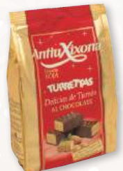
Delicias de turrón ANTIU XIXONA al chocolate, 125 grs.