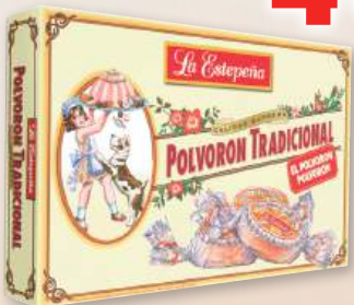
Polvorón tradicional LA ESTEPEÑA , 650 grs.