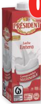
Leche PRÉSIDENT entera, desnatada o semidesnatada, litro.