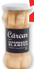
Espárragos blancos CÁRCAR extra gruesos, 6/9, 540 grs., 325 grs. p.e.