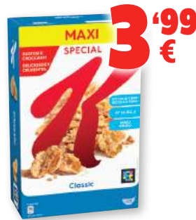
Cereales KELLOGG'S Special K, 700 grs.