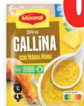
Sopa MAGGI gallina con fideos finos, hogareña, pollo con fideos u 11 verduras, sobre.