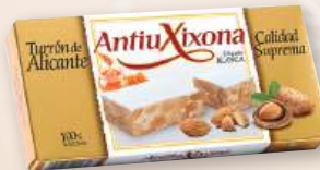
Turrón calidad suprema ANTIU XIXONA Alicante o Jijona, 200 grs.