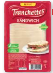
Queso sándwich TRANCHETTES , 8 lonchas, 160 grs.