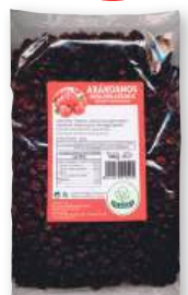
Arándanos EL NOGAL deshidratados, 1 kilo.