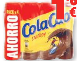
Batido de cacao COLA CAO Energy, pack 4 unds. x 188 ml.