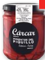
Pimientos del Piquillo CÁRCAR extra, 15/22, 425 grs., 350 grs. p.e.