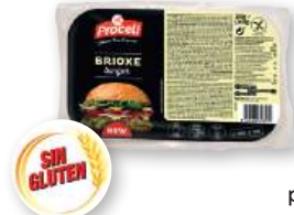
Pan Brioxe burger PROCELI sin gluten, pack 2 unds. x 90 grs.