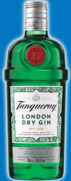
Ginebra TANQUERAY , 70 cl.