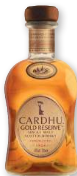
Whisky CARDHU Gold Reserva, 70 cl.