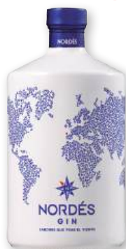
Ginebra NORDÉS Atlantic Galician, 70 cl.