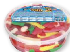
Gominolas VIDAL megasurtido ácido, brillo o happy mix, 360 grs.