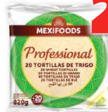
Tortillas de trigo MEXIFOODS , 20 cm., pack 20 unds., 820 grs.