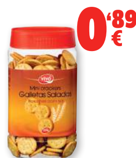
Galletas saladas VIVÓ redondas, 350 grs.