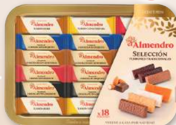
Selección de turrónes tradicionales EL ALMENDRO , 400 grs.