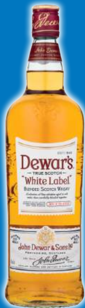
Whisky DEWAR'S White Label, litro.