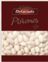
Piñones DELAVIUDA , 150 grs.