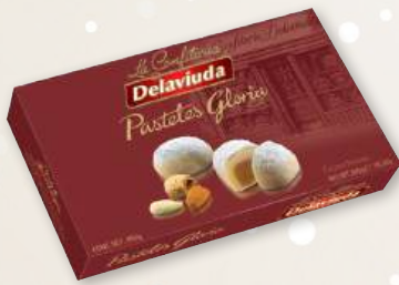
Pasteles Gloria DELAVIUDA , 300 grs.