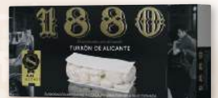
Turrón 1880 Alicante o Jijona, 250 grs.