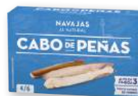
Navajas CABO DE PEÑAS al natural 4/6, OL-120, 60 grs. p.e.