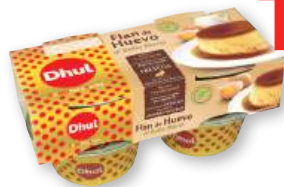
Flan de huevo DHUL original o sin lactosa, pack 4 unds. x 110 grs. o 0% azúcar y 0% materia grasa, pack 4 unds. x 100 grs.