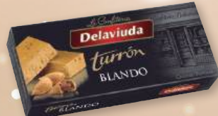
Turrón DELAVIUDA blando o duro, 250 grs.