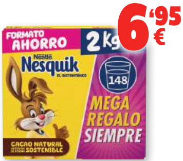
Cacao soluble NESQUIK , 2 kilos.