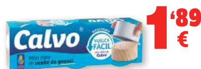
Atún claro CALVO al natural, en escabeche o en aceite de girasol, RO-80, pack 3 unds. x 52 grs. p.e.