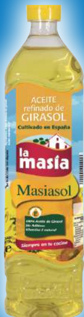
Aceite de girasol LA MASÍA Masiasol, litro.