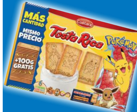
Galletas Tosta Rica CUÉTARA , 760 grs.