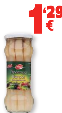
Espárragos blancos VIVÓ extra 9/12 unds., 370 grs., 205 grs. p.e.