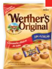
Caramelos sin azúcar WERTHER'S original o cappuccino, 90 grs.