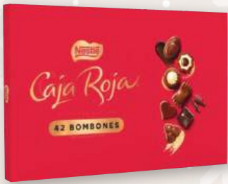
Bombones NESTLÉ Caja Roja, 398 grs.