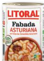
Fabada Asturiana LITORAL , 1 ración, 420 grs.