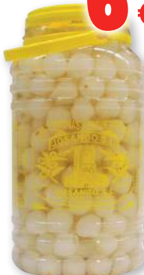
Cebollitas pequeñas JOSANGO , 3,3 kilos, 2 kilos p.e.