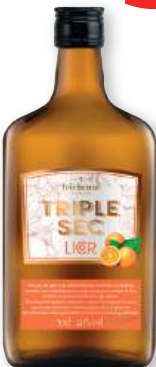
Licor TEICHENNÉ triple seco, 70 cl.