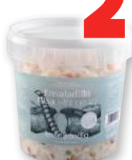
Ensaladilla Rusa ENSALANDIA básica, 880 grs.