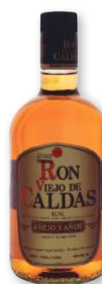
Ron VIEJO DE CALDAS , 70 cl.