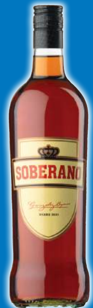
Brandy SOBERANO , 3 litros.