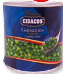
Guisantes CIDACOS , 2,5 kilos, 1,6 kilos p.e.