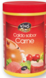
Caldo VIVÓ CHEF carne, pescado o pollo, 1 kilo.