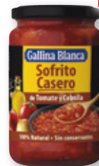
Pisto GALLINA BLANCA o sofrito de tomate y cebolla o tomate y verduras, 350 grs.