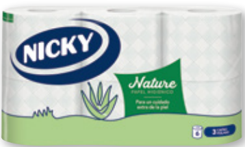
Papel higiénico NICKY Nature aloe vera, 3 capas, 6 rollos.