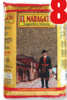
Lenteja Pardina EL MARAGATO , 5 kilos.