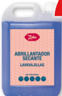
Abrillantador secante lavavajillas ZORKA , 5 litros.