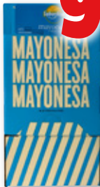
Mayonesa SABORALSA , pack 200 unds. x 14 ml.