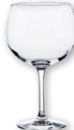
Copa combinado ARC peak, 70 cl., pack 6 unds.