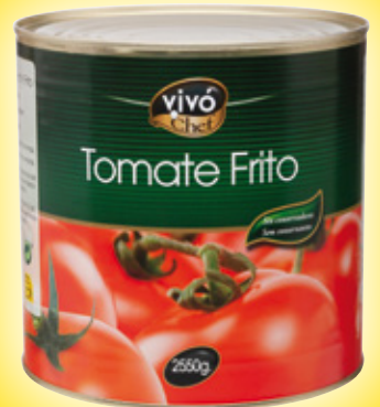
Tomate frito VIVÓ CHEF , 2.550 grs.