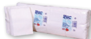
Servilletas mini service GC , pack 400 unds.