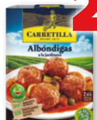
Albóndigas a la jardinera CARRETILLA , 300 grs.