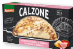
Calzone NATURACCI jamón y queso, 380 grs.