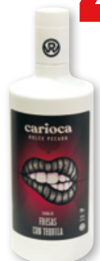
Crema de fresas con tequila CARIOCA , 70 cl.