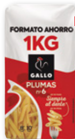
Pasta clásica tenedor GALLO plumas ó o spaghetti, 1 kilo.