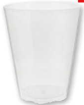
Vaso ATP combi, 450 ml., pack 25 unds.