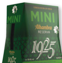
Cerveza ALHAMBRA Reserva 1925 mini, pack 6 unds. x 22,5 cl.