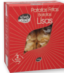
Patatas fritas lisas VIVÓ CHEF , pack 2 unds. x 500 grs.