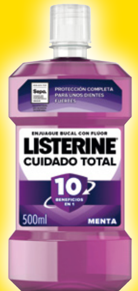
Enjuague LISTERINE cuidado total o dientes y encías, 500 ml.