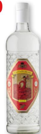
Anís dulce CASTAÑUELAS , litro.