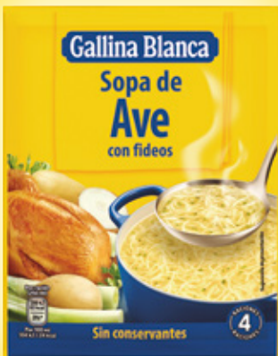
Sopa GALLINA BLANCA variedades, sobre