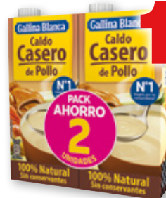
Caldo casero 100% natural GALLINA BLANCA pollo o cocido, pack 2 unds. x 1 litro.