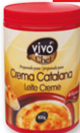
Crema Catalana VIVÓ CHEF , 800 grs.