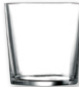
Vaso pinta ARC , 36 cl., pack 6 unds.