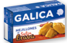
Mejillones GALICA en salsa brava, salsa de albariño o la vinagreta, OL-120, 65 grs. p.e.