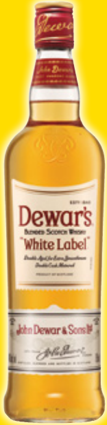
Whisky DEWAR'S White Label, 70 cl.