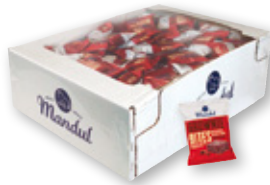
Brownie bites MANDUL , 2,5 kilos.