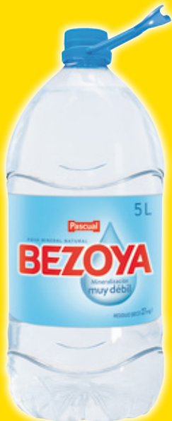
Agua mineral BEZOYA , 5 litros.