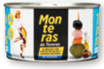
Monteras TORERAS sabor anchoa, 120 grs. p.e.