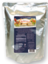
Atún BERAZA en aceite de girasol, 1 kilo, 950 grs. p.e.