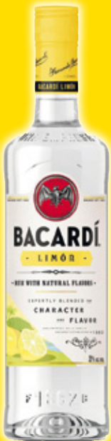
Ron BACARDÍ limón, 70 cl.