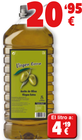
Aceite de oliva Virgen Extra, 5 litros.