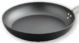
Sartén de aluminio QUID PRO Gastrum inducción, 28 cm., unidad.