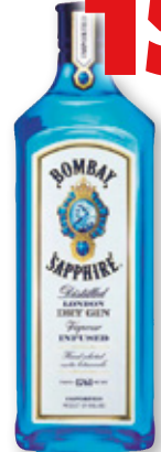
Ginebra BOMBAY Sapphire, litro.