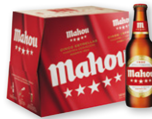
Cerveza MAHOU Cinco Estrellas, pack 12 unds. x 25 cl.