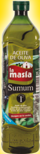
Aceite de oliva LA MASÍA Sumum 1°, litro.