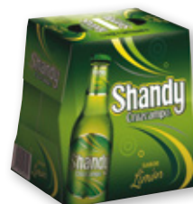
Cerveza Shandy CRUZCAMPO , pack 6 unds. x 25 cl.