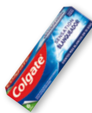
Denífrico COLGATE blanqueador, 75 ml.