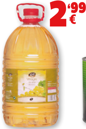
Vinagre de vino blanco VIVÓ CHEF , 5 litros.