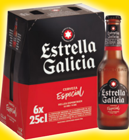
Cerveza Especial ESTRELLA GALICIA , pack 6 unds. x 25 cl.