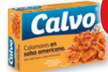
Calamares en salsa americana CALVO , RR-125, 72 grs. p.e.