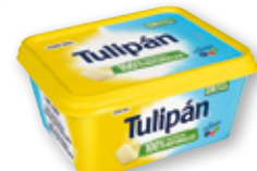
Margarina con sal TULIPÁN hostelería, 900 grs.