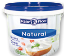
Queso para untar RENY PICOT , 2 kilos.