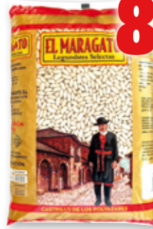
Alubia blanca EL MARAGATO , 5 kilos.