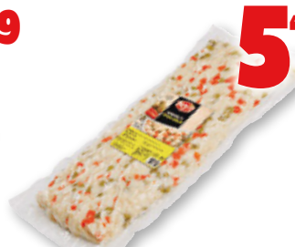
Preparado de ensaladilla BENIS , 2 kilos.