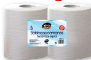
Bobina secamanos VIVÓ CHEF , 1 capa, pack 2 unds., 300 metros.