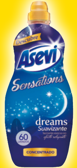
Suavizante Sensations ASEVI dreams o zen, 60 dosis, 1.320 ml.