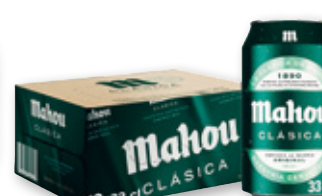
Cerveza MAHOU Clásica, pack 12 unds. x 33 cl.