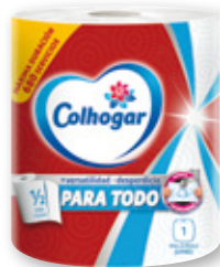
Papel de cocina COLHOGAR para todo, 1 rollo.