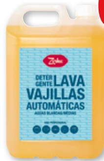
Detergente lavavajillas ZORKA aguas medias, 5 litros.