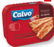
Filetes de sardina CALVO en salsa picantona, 100 grs., 75 grs. p.e.