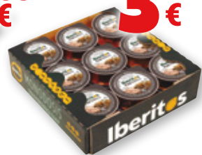
Paté Ibérico IBERITOS , pack 18 unds. x 23 grs.