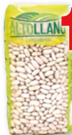
Alubia blanca larga ALTOLLANO , 1 kilo.