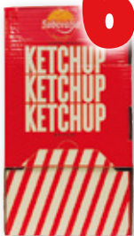
Ketchup SABORALSA , pack 200 unds. x 12 grs.