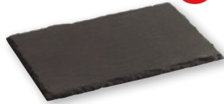
Pizarra para tapas GASTRO FUN , 20x13 cm., unidad.