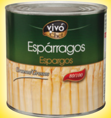
Espárragos VIVÓ CHEF 80/100, 2,5 kilos, 1,6 kilos p.e.