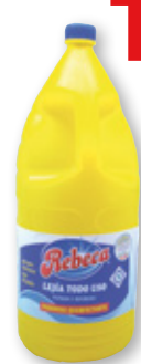
Lejía REBECA normal o lavadora, 4 litros.