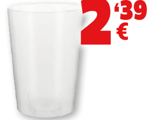
Vaso ATP sidra, irrompible, 600 ml., pack 25 unds.