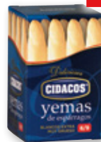
Yemas de espárragos blancos CIDACOS 6/9, 155 grs., 100 grs. p.e.