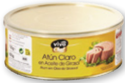
Atún claro en aceite de girasol VIVÓ CHEF , RO-800, 650 grs. p.e.