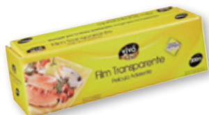
Film transparente VIVÓ CHEF , 300 metros.