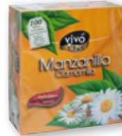
Infusión VIVÓ CHEF manzanilla, menta-poleo o té negro, pack 100 unds.