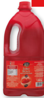
Salsa brava VIVÓ CHEF , 1.850 grs.