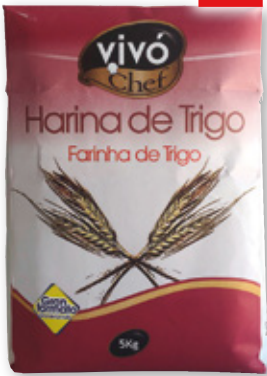
Harina de trigo VIVÓ CHEF , 5 kilos.