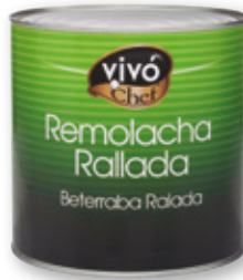
Remolacha rallada VIVÓ CHEF , 2,4 kilos, 1,55 kilos p.e.