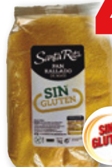
Pan rallado de maíz SANTA RITA sin gluten, 1 kilo.