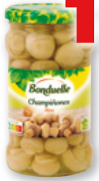
Champiñones enteros BONDUELLE mini, 280 grs., 170 grs. p.e.