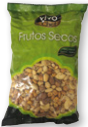
Cocktail VIVÓ CHEF extra, 1 kilo.