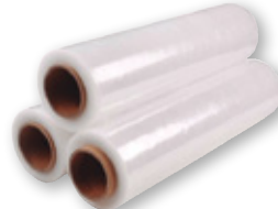
Film catering BANDESUR , 45x300, pack 3 unds.