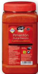
Pimentón VIVÓ CHEF Esencia dulce o picante, 750 grs.