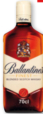
Whisky BALLANTINE'S , 70 cl.