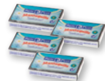
Mantequilla RENY PICOT micropastillas, pack 100 unds. x 15 grs.