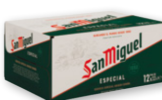
Cerveza SAN MIGUEL , pack 12 unds. x 33 cl.