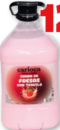
Crema de fresas con tequila CARIOCA , 3 litros.