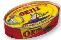
Bonito del Norte ORTIZ en aceite de oliva o en escabeche, OL-120, 82 grs. p.e.