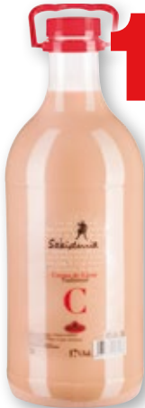
Crema de orujo REYTHOR , 3 litros.