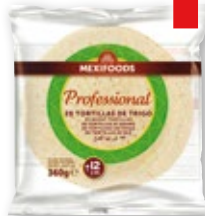
Tortilla de trigo MEXIFOODS , 12 cm., pack 20 unds., 360 grs.