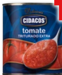
Tomate triturado CIDACOS , 800 grs.