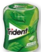
Chicle TRIDENT hierbabuena o fresa, 82 grs.