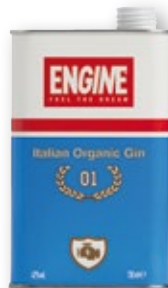
Ginebra ENGINE , 70 cl.