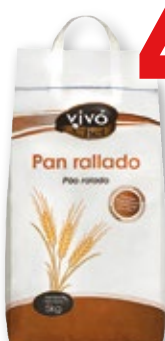
Pan rallado VIVO CHEF , 5 kilos.