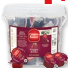
Vinagre de vino CAPRICHO ANDALUZ , pack 100 cápsulas x 10 ml.