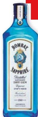
Ginebra BOMBAY Sapphire, litro.