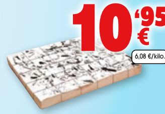
Tarta Selva Trufa precortada, 30 raciones, 1.800 grs.