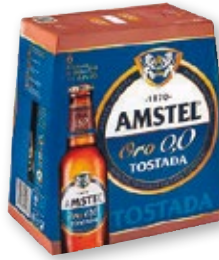
Cerveza AMSTEL Oro 0,0 tostada, pack 6 unds. x 25 cl.