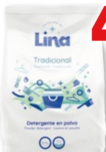
Detergente LA COLADA DE LINA Tradicional, 150 lavados.