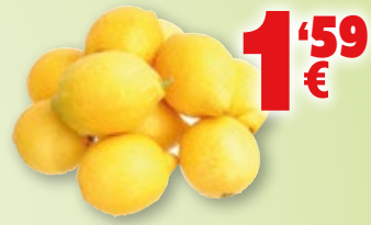
Limón categoría 1º, malla de 1 kilo aprox.