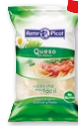
Queso en polvo RENEY PICOT , 1 kilo.