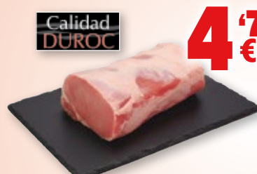
Cinta de lomo de cerdo, kilo.