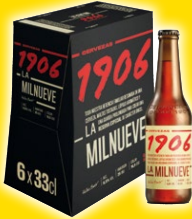
Cerveza 1906 La Milnueve, pack 6 unds. x 33 cl.