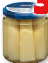
Yemas de espárragos CIDACOS gruesas, 345 grs., 205 grs. p.e.