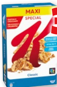
Cereales KELLOGG'S Special K, 700 grs.