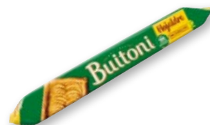
Masa de hojaldre BUITONI rectangular, 230 grs.