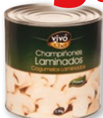
Champiñones laminados VIVO CHEF , 2,5 kilos, 1,33 kilos p.e.