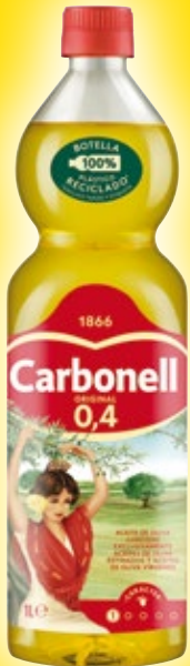
Aceite de oliva CARBONELL original 0,4 o sabor 1°, litro.