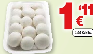
Champiñón, bandeja de 250 grs. aprox.