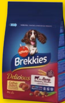
Alimento para perros adultos BREKKIES Delicious, 3 kilos.