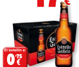
Cerveza Especial ESTRELLA GALICIA , pack 24 unds. x 33 cl.