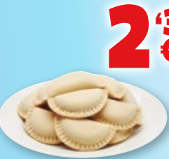
Mini empanadillas de atún, bolsa de 1 kilo.