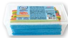
Regaliz VIDAL cintas multicolor, dulcifica fresa o dulcitar fresa, 290 grs.