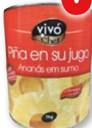
Piña en su jugo VIVO CHEF , 3 kilos, 1,79 kilos p.e.