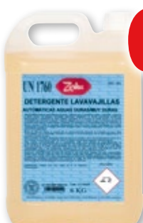
Detergente lavavajillas automáticas ZORKA aguas duras/muy duras, 6 kilos.