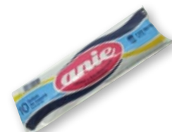
Bolsa de basura ANIE 85x105 cm., pack 10 unds. 10 kilos.