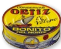
Bonito del Norte ORTIZ en escabeche, RO-1.800, 1.400 grs. p.e.