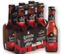
Cerveza ESTRELLA GALICIA mini, pack 6 unds. x 20 cl.