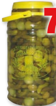
Cóctel vegetal JOSANGO , 3,4 kilos, 2 kilos p.e.