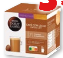
Café NESCAFÉ Dolce Gusto con leche, cortado, espresso intenso o espresso intenso descafeinado, pack 16 cápsulas.