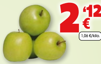
Manzana Golden, bolsa de 2 kilos aprox.