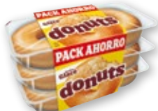
DONUTS Glacé, pack 6 unds.