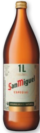
Cerveza SAN MIGUEL , litro.