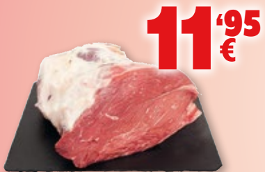
Centro de cadera de vacuno, kilo.