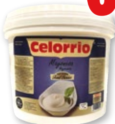
Mayonesa CELORRIO , 3.600 ml.