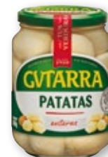
Patata entera GVTARRA , 660 grs., 450 grs. p.e.