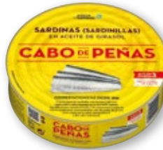
Sardinillas CABO DE PEÑAS en aceite de girasol, RO-550, 385 grs. p.e.