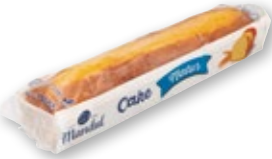
Cake MANDUL natural o marble, 550 grs.