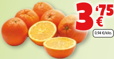
Naranja de zumo, malla de 4 kilos aprox.