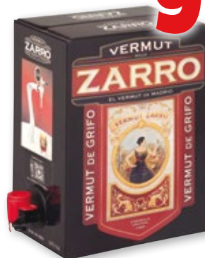
Vermuth rojo ZARRO , 3 litros.