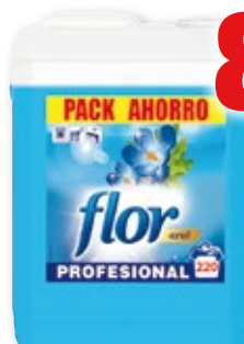
Suavizante FLOR profesional azul, 10 kilos.