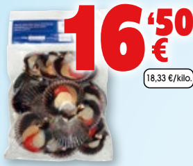
Vieira del Pacífico BARANDICA 15/25, bolsa de 900 grs.