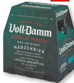
Cerveza VOLL-DAMM , pack 6 unds. x 25 cl.