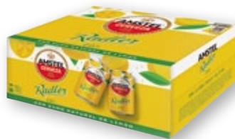
Cerveza AMSTEL Radler , pack 12 unds. x 33 cl.