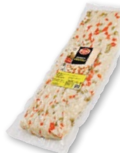
Preparado de ensaladilla BENIS , 2 kilos.