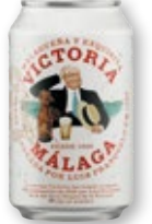
Cerveza VICTORIA , 33 cl.