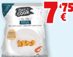
Cola vista rebozada IBERCOOK , bolsa de 1 kilo.