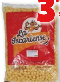
Bolas sabor queso LA ISARIENSE , 1 kilo.