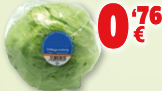
Lechuga iceberg, unidad.