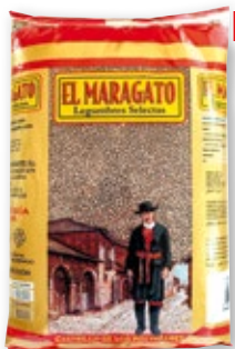
Lenteja Parda EL MARAGATO , 5 kilos.