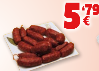
Chorizo casero oreado o pincho, kilo.