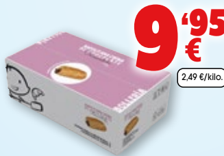
Napolitana de chocolate fermentada, 95 grs. pack 42 unds.