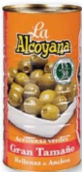
Aceitunas LA ALCOYANA rellenas de anchoa, 2.000 grs., 600 grs. p.e.