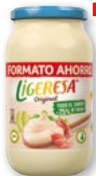
Salsa fina LIGERESA , 425 ml.