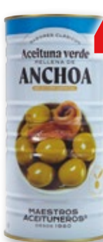
Aceituna verde rellena de anchoa MAESTROS ACEITUNEROS , 1.400 grs., 600 grs. p.e.