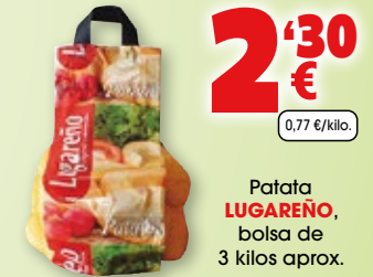
Patata LUGAREÑO , bolsa de 3 kilos aprox.