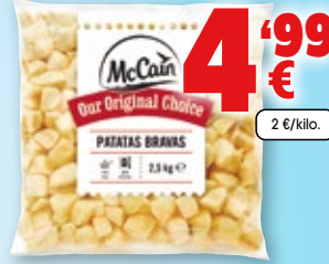
Patatas bravas McCAIN , bolsa de 2,5 kilos.