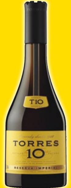
Brandy TORRES 10 , 70 cl.