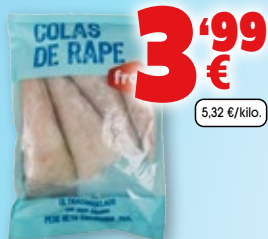
Colas de rape FROXÁ , bolsa de 1 kilo, 750 grs. p.e.