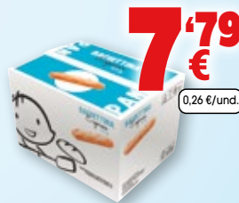
Pan PANAMAR baguettina express, 120 grs., pack 30 unds.