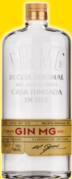
Ginebra MG original, 70 cl.