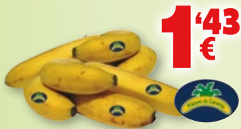
Plátano origen Canarias, categoría 1º, kilo.