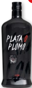
Licor PLATA O PLOMO , 70 cl.