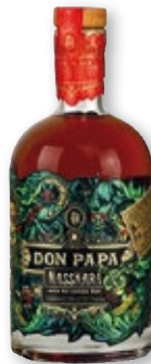
Ron DON PAPA Masckara añejo, 70 cl.