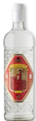
Anís dulce CASTAÑUELAS , litro.