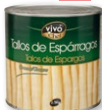
Tallos de espárragos VIVO CHEF , 2,5 kilos, 1,6 kilos p.e.