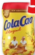
Cacao COLA CAO , 383 grs.