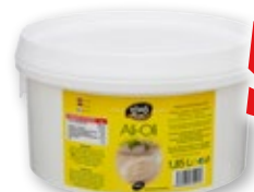
Salsa Ali-Oli VIVO CHEF , 1.850 ml.