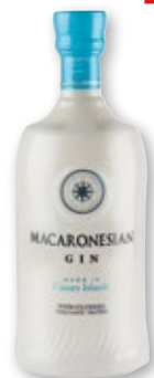
Ginebra MACARONESIAN , 70 cl.