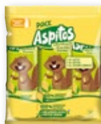
ASPITOS , pack 6 bolsas x 3 unds.