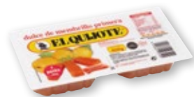
Dulce de membrillo EL QUIJOTE primera, 400 grs.