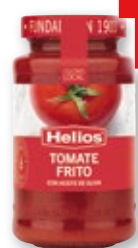
Tomate frito HELIOS , 570 grs.