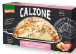
Calzone NATURACCI jamón y queso, 380 grs.