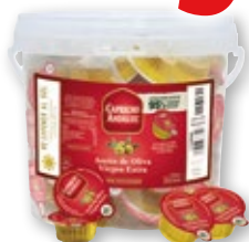
Aceite de oliva Virgen Extra CAPRICHO ANDALUZ , pack 100 cápsulas x 10 ml.