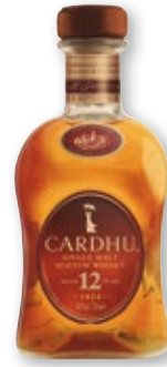
Whisky CARDHU Malta 12 años, 70 cl.