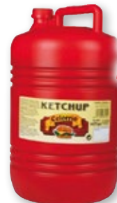
Kétchup CELORRIO , 4,875 kilos.