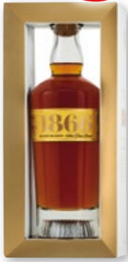
Brandy 1866 , 70 cl.