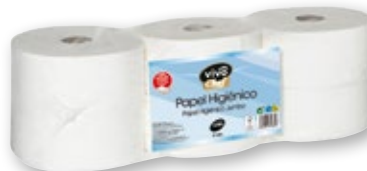
Papel higiénico industrial VIVO CHEF , 124 metros, 2 capas, pack 6 unds.