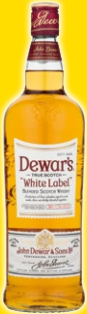
Whisky DEWAR'S White Label, litro.