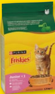
Alimento para gatos FRISKIES Junior, 1,5 kilos.