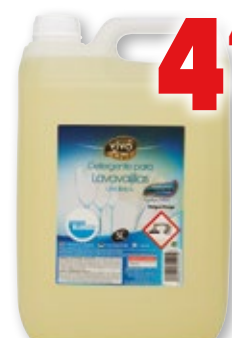
Lavavajillas VIVO CHEF aguas blandas, 5 litros.