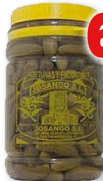
Pepinillo mediano JOSANGO , 3,3 kilos, 2 kilos p.e.