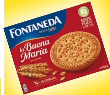
Galletas FONTANEDA la Buena María, 707 grs.