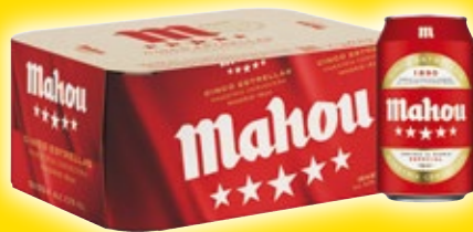
Cerveza MAHOU Cinco Estrellas, pack 12 unds. x 33 cl.