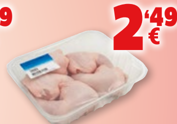
Traseros de pollo, kilo.