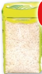
Arroz largo, kilo.