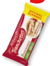
Queso TRANCHETTES , 44 lonchas, 825 grs.