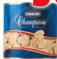
Champiñón laminado CIDACOS , 2,5 kilos.