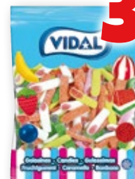
Gominolas VIDAL variedades, 1 kilo.