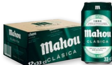
Cerveza MAHOU Clásica, pack 12 unds. x 33 cl.