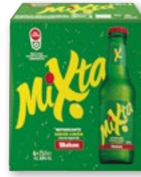
Cerveza MAHOU Mixta , pack 6 unds. x 25 cl.