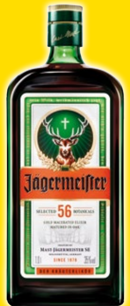
Licor JÄGERMEISTER , litro.