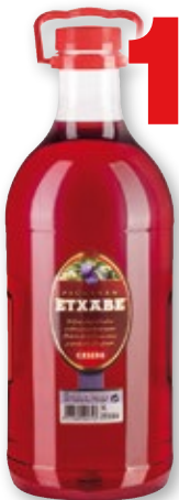
Pacharán ETXABE , 3 litros.