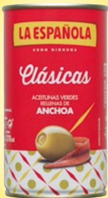
Aceitunas LA ESPAÑOLA rellenas de Anchoa, 350 grs., 150 grs. p.e.