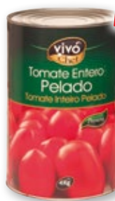
Tomate entero pelado VIVO CHEF , 4 kilos, 2,7 kilos p.e.