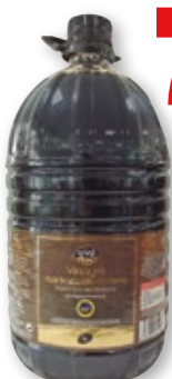
Vinagre balsámico de Módena VIVO CHEF , 5 litros.