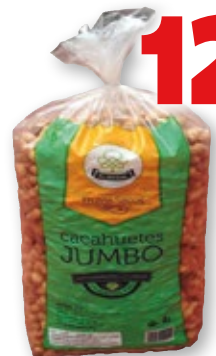
Cacahuete Jumbo tostado EL NOGAL , 3 kilos.