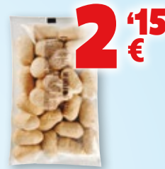
Croquetas artesanas de jamón URKABE , kilo.