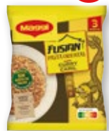
Pasta oriental MAGGI Fusian pollo o curry, 71 grs.