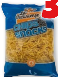
Patatas paja LA ISARIENSE , 800 grs.