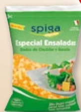
Queso en dados Cheddar y Gouda SPIGA , 1 kilo.