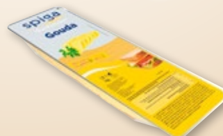
Queso Gouda SPIGA , 50 lonchas x 20 grs.