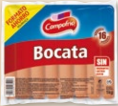
Salchichas Bocata CAMPOFRÍO , 1 kilo.