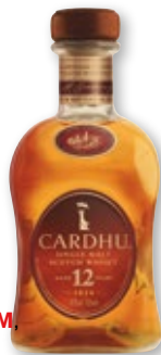
Whisky CARDHU Malta 12 años, 70 cl.