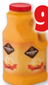
Salsa RANCHERA M-XICO mejicana, queso o guacamole, 2 litros.