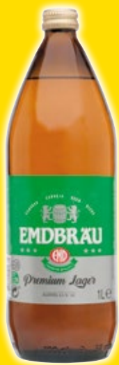
Cerveza EMBRÄU , litro.