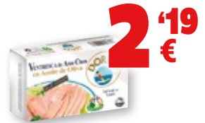
Ventresca de atún claro DORITA en aceite de oliva, RR-125, 110 grs., 72 grs. p.e. 2'19 €