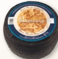
Queso semicurado mezcla QUESEURO , kilo.