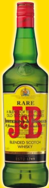
Whisky J&B Rare , 70 cl.