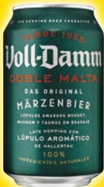
Cerveza VOLL-DAMM , 33 cl.