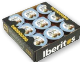
Paté IBERITOS al Pedro Ximénez o de atún, pack 18 unds. x 25 grs.