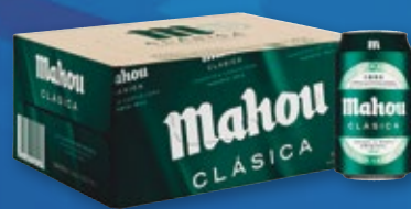
Cerveza MAHOU Clásica, pack 12 unds. x 33 cl.