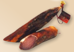
Bacon ahumado ARGAL , en mitades, kilo.