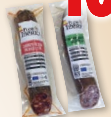
Centro de jamón de cebo Ibérico 50% raza Iberica FLOR IBÉRICA , en mitades, kilo.