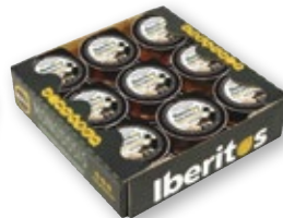
Crema de jamón york o jamón curado IBERITOS , pack 18 unds. x 25 grs.