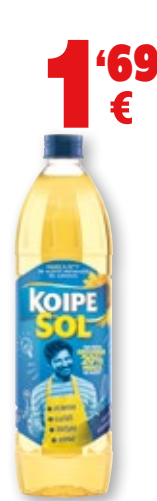
Aceite de girasol KOIPESOL , litro. 1'69 €