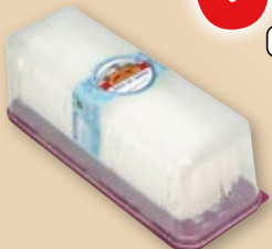
Queso rulo de cabra-vaca MARQUÉS DEL CASTILLO , 850 grs.