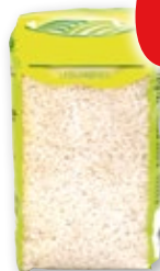
Arroz largo, kilo.