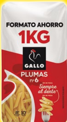
Pasta Clásica GALLO tenedor, plumas 6 o spaghetti 3, 1 kilo.