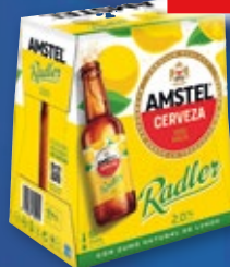
Cerveza AMSTEL Radler, pack 6 unds. x 25 cl.