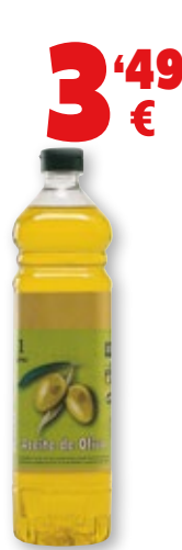
Aceite de oliva suave o intenso, litro. 3'49 €