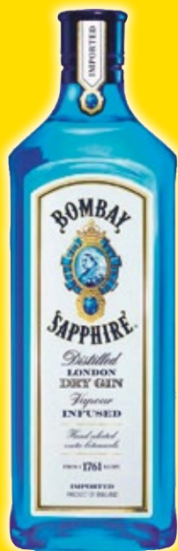
Ginebra BOMBAY Sapphire , litro.