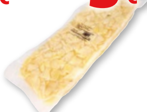
Patatas corte para tortilla o tipo brava, 2 kilos.