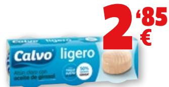
Atún claro ligero CALVO en aceite de girasol, pack 3 unds., 180 grs., 168 grs. p.e. 2'85 €