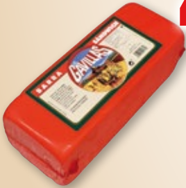
Barra sándwich LAS GAVILLAS , kilo.