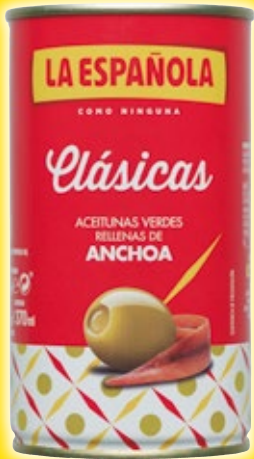
Aceitunas rellenas de Anchoa LA ESPAÑOLA , 350 grs., 150 grs. p.e.