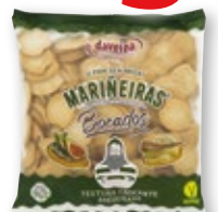
Mariñeiras DAVEIGA Bocados con aceite de oliva, 500 grs.