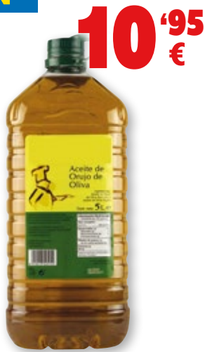
Aceite de orujo de oliva, 5 litros. 10'95 €