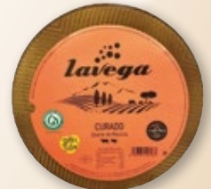
Queso curado mezcla LAVEGA , kilo.