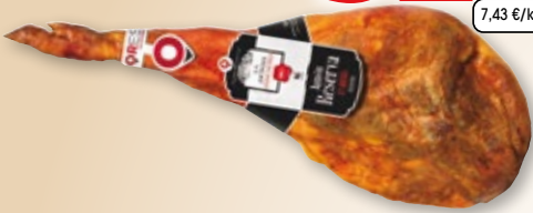
Jamón serrano Reserva LA ANTIGUA JAMONERÍA , pieza de 7 A 7,5 kilos aprox.