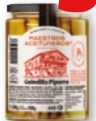
Guindilla Piparra MAESTROS ACEITUNEROS , 390 grs., 150 grs. p.e.