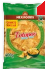
Totopos MEXIFOODS , 400 grs.