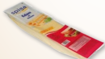
Queso Edam SPIGA , 50 lonchas x 20 grs.