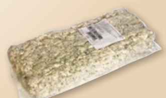
Queso azul desmenuzado SPIGA , kilo.