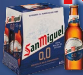
Cerveza SAN MIGUEL 0,0 , pack 6 unds. x 25 cl.