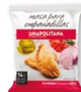
Masa para empanadillas LA NAPOLITANA , 420 grs.