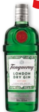
Ginebra TANQUERAY , 70 cl.