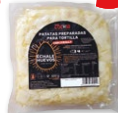
Patatas preparadas para tortilla ÉCHALE HUEVOS con o sin cebolla, 900 grs.