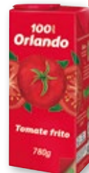
Tomate frito ORLANDO , 780 grs.